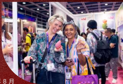
2025年8月 展中海外观众结构 多元化趋势